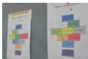
ダイヤモンドランキング