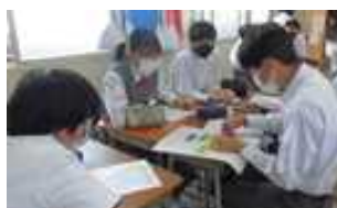
学級での話し合い