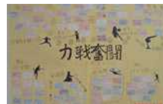
1・2年からのメッセージ