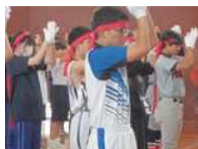
応援委員のエール