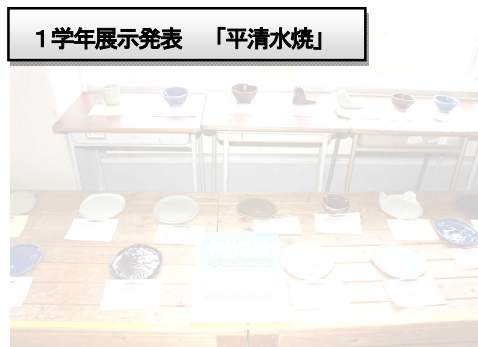
1学年展示発表 「平清水焼」