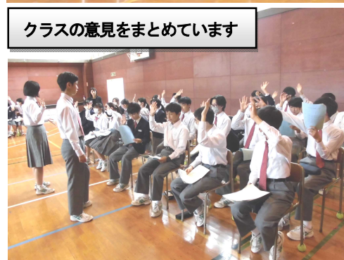
クラスの意見をまとめています