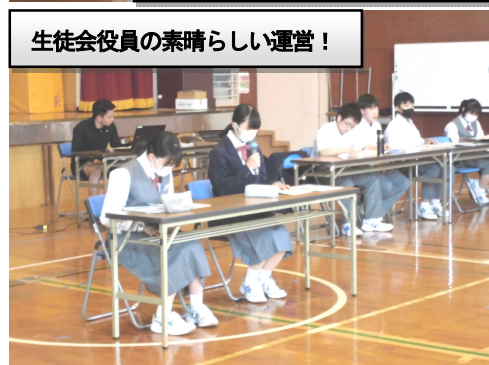
生徒会役員の素晴らしい運営!