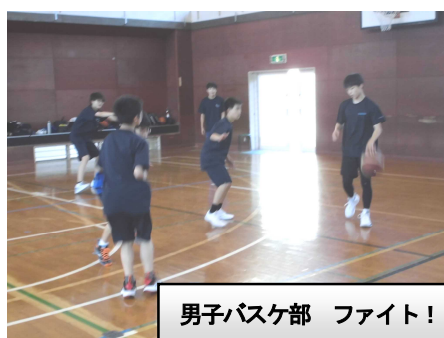
男子バスケット部 ファイト！