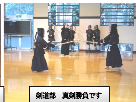
剣道部 真剣勝負です

た。それでも、与えられた環境でできることをひたすら継続してきました。現在、多くの部活動で週末は練習試合を行っています。子どもたちは、日頃の練習の成果がうまくプレイに繋がることもあれば、課題が出てくることもあります。なんとか修正して本番を迎えてほしいと思います。子どもたちが夢中になって取り組んでいる姿を見ると「頑張っ！」と心から応援してしまいます。生徒たちが部活動で経験したことがこれからの生活の糧になればよいと思います。健闘を祈っています！