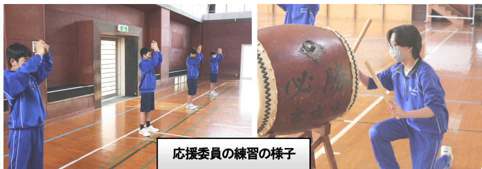
応援委員の練習の様子

のエールを猛練習しています。全校生徒が大きな声を出し、エールで心を一つにすることで、選手の躍動を後押ししてきました。今後は各学級で、