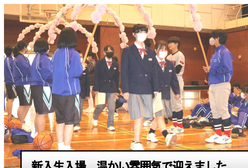
新入生入場 温かい雰囲気です

新入生代表のFRさんからは「僕が中学校で楽しみにしているのは、合唱祭や吉中祭などの行事です。小学校にない行事が増えるので、友達や先輩と協力して、良い思い出を作りたいです。頑張っていきたいことは、勉強と部活動を両立させることです。中学生になると勉強が難しくなり、教科も増え「大変だ」と思います。また、部活動も始まるので、とても忙しくなると聞いています。だから、授業を集中して聞き、家でも勉強をかかさないようにしながら、部活動も本気でやりたいです。僕たちは、このように中学校生活を楽しみにしていますが、不安もあります。まだ分からないこともたくさんあるので、先生方や先輩方にお聞きしながら、楽しんでいきたいです。今日は本当にありがとうございました」と2・3年生へのお礼の気持ちも込められた挨拶がありました。