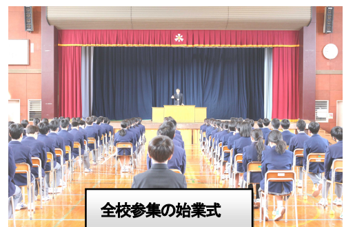
全校参集の始業式