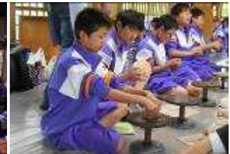
山寺での班別研修