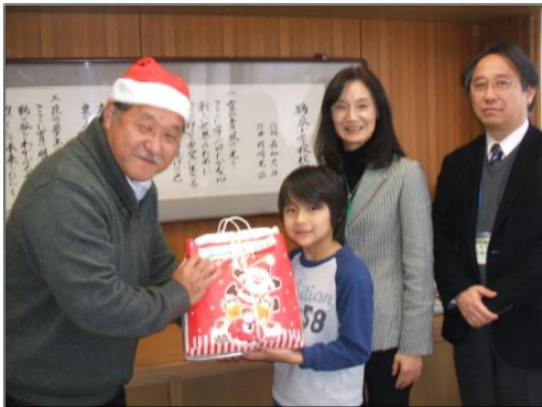
サンタさん?から校長室でいただきました

12月21日(水), 鶴谷小学校に2つの素敵なプレゼントが届きました。一つは、鶴谷小学校の全ての子供たちに…。もう一つは6年生の心に届けていただきました。それではご紹介しましょう。