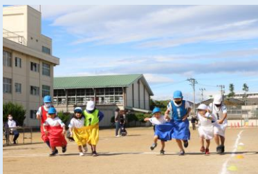
1・6年「デカパンリレー」

お忙しい中、応援に駆けつけてくださった保護者、地域の皆様、ありがとうございました。