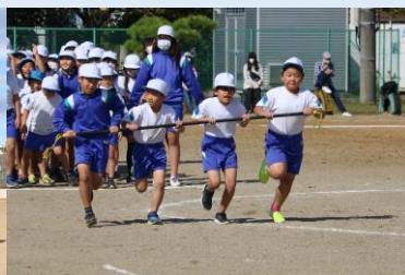
2・5年「ミニタイフーン」