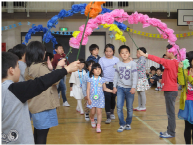
花のアーチをくぐって入場です

プレゼント贈呈では2年生からアサガオの種をいただきました。最後に1年生からお礼の言葉とかわいい歌の発表がありました。5年生が飾り付けをした体育館で全校児童に迎えられた1年生は、この日から芝蘭児童会の一員になりました。立町小ではこのような「たてわり活動」がたくさんあります。