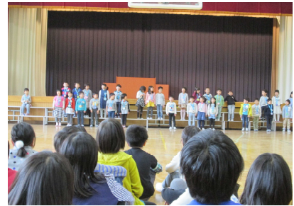
1年生からはお礼の歌が披露されました