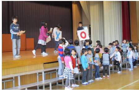
〇×ゲームで盛り上がりました