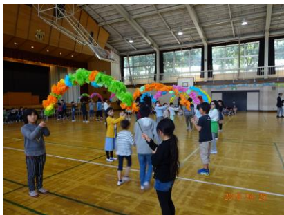
花のアーチをくぐって入場です

プレゼント贈呈では、2年生からアサガオの種を受け取りました。1年生からは、お礼の言葉とかわいい歌の発表がありました。5年生が飾り付けをした体育館で全校児童に迎えられた1年生。最後に校長先生から、「1年生のみなさんは、今から芝蘭児童会の一員になりました。」とお話がありました。