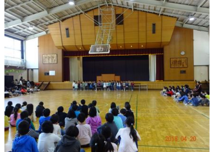
1年生からはお礼の歌が披露されました