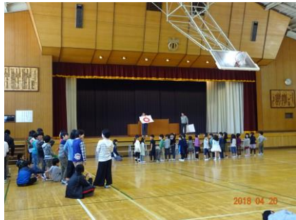
O×ゲームで盛り上がりました