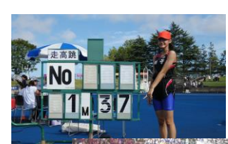
走り高跳 No 1m37