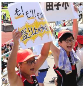
田子小 も！も！も！ 盛り上げよう