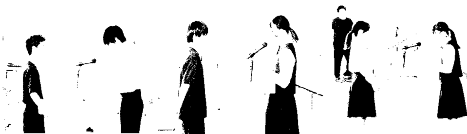
←質疑に答える委員長たち

質疑は1・2年生からのものが多く、3年生の分かりやすい説明で、スムーズに終了していました。