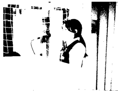
↓議長の采配が素晴らしい。