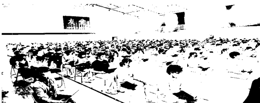
↑資料はクロームブックを見ます。まさに、ペーパーレス時代。

所属名を呼ばれたら、返事⇒発表⇒応答という一連の活動の中で、はっきりとした声で堂々と発表していたことを誇らしく思いました。3年生の貫禄を感じました。