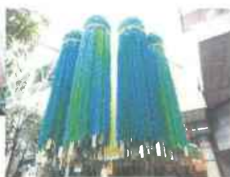
平成 25 年度