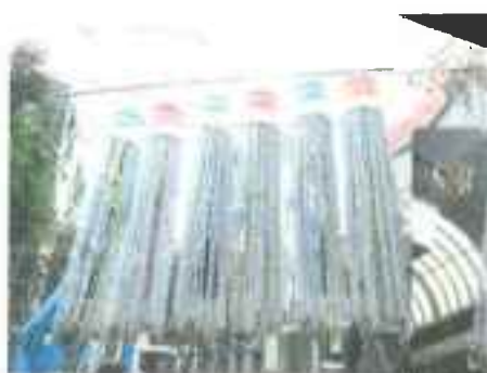
平成 23 年度