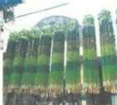
平成 27 年度