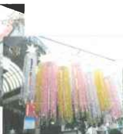
平成 24 年度