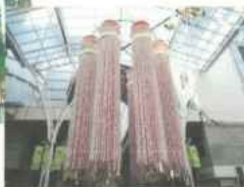
平成 28 年度