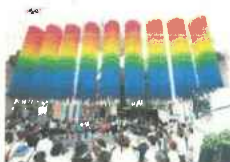
平成 26 年度