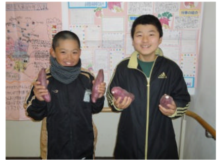
【甘藷をもってハイポーズ！】

今年も押し迫ってまいりました。間もなく冬休みに入ります。今年の漢字は「絆」ということですが、東日本大震災の後、国内外からたくさんの温かい支援をいただき、改めて人と人のつながりの尊さを実感しております。特に、印象に残っているのは、読み方こそ違いますが岐阜県と滋賀県の七郷（ななさと）小学校から届いたメッセージです。岐阜県の七郷小学校では運動会や地区の連合音楽会で仙台市の七郷小学校に向けて復興のエールを行ってくださったそうです。その様子が収められたDVDが送られてきましたので、昼の校内放送等で紹介していく予定です。そして、滋賀県の七郷小学校からはお米を2袋いただきました。今年度お米作りができなかった5年生を心配して、はるばる遠くから送っていただきました。併せて4年生が作ったかわいらしいドライフラワーも送られてきました。また、本校から宮崎県串間市立大串（おおつか）小学校に転出した児童の縁で、メッセージと甘藷が送られてきました。詳細につきましては本校HPのブログをご覧ください。