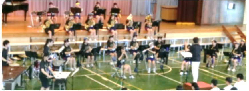
↑ 圧巻の吹奏楽部の演奏

9月15日(金)に七中祭を実施しました。今年度は、暑さ対策のため、2週間延期した上での開催となりました。当日は、これまでと比べれば過ごしやすい気温となり、予定通り体育館でのステージ発表を行うことができました。リモートを併用しましたが、通信上のトラブルのため、保健委員会の発表は途切れてしまった部分がありました。こちらは、後日改めて発表の場を設ける予定です。しかしながら、保健委員会の発表を含め、国語弁論や吹奏楽部の演奏、生徒会によるソーラン、有志の発表、実行委員企画、どれをとっても生徒たちの努力と工夫の様子が感じられ、とても感心させられました。何よりも発表をしている生徒のみんなの笑顔、真剣なまなざしが印象的でした。聞くべきところは聞く、盛り上がるところは盛り上がる、そういったメリハリを大事にし、最高の雰囲気を作り上げた「聴衆」としての生徒のみんなの態度も素晴らしかったです。最高の七中祭でした！