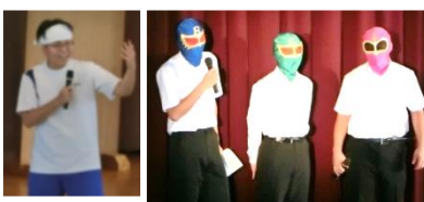
↑ 会場を沸かせてくれた皆さん ↑