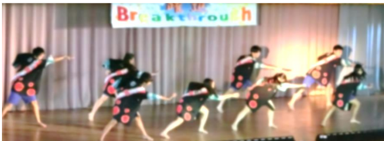
↑ 迫力あるソーランの演舞