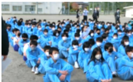
↑ 校庭で整列している様子

5月1日(月)6校時に地震を想定した避難訓練が行われました。地震発生の放送の後、まずは初動訓練として机の下に身をかがめ、安全を確保しました。その後、校舎内からクラスごとの避難経路を通り、校庭南側に全校生徒が一斉に避難し、避難開始から全校の人数確認までの時間は約4分24秒でした。どの学年も、静かにスムーズに行動しており、防災への意識の高さがうかがえました。東日本大震災の際には、学区内にも大きな被害が出ています。その後も日本各地で大きな自然災害が発生しており、そのような脅威への備えが常に求められています。七郷中生には、「確実に自分の身を守ることができる」というだけでなく、「身近な人や地域の人々の安全のために率先して行動できる」存在になってほしいと思っています。保護者の皆さんや地域の方々のご協力、よろしくお願いいたします。