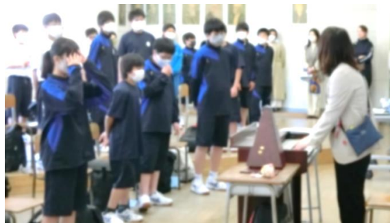
↑ 1-2 音楽の授業