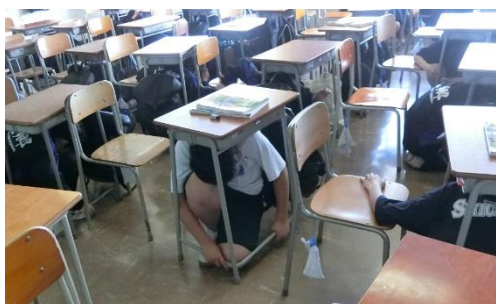
↑ 机の下に避難しています