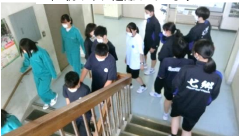
↑ 静かに階段を移動しています