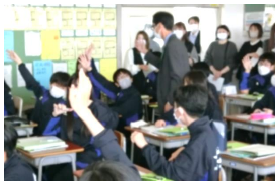
↑ 1-3 英語の授業

授業参観の後には、PTA総会・学年保護者会・学級懇談会が行われました。コロナ禍で、保護者の皆さんが一堂に会する場面をなかなか作ることができませんでしたが、今回も皆さんと顔を合わせて話し合いを進めることができました。コロナ禍は苦しいものですが、それを経たからこそ、人と人とのつながりの大切さを実感できた一面はあると思います。今後も、学校と保護者の皆さんとの連携をより密にしていければと考えております。よろしくお願いいたします。