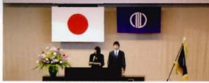
仙台市立仙台商業高等学校 開校式

生徒会は執行部を中心に、全校生徒の協力を得ながら「自分たちの問題は自分たち自身で、自分たちの行事は自分たちの手で」をモットーに生徒総会、各種委員会活動及び仙商祭やその他生徒会行事を積極的に行っています。