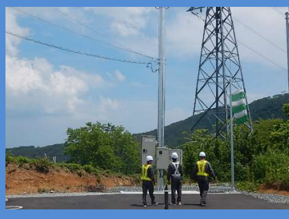
デュアルシステム