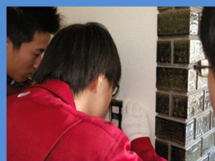
テクノボランティア