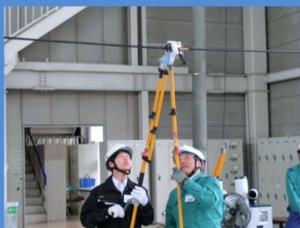
インターンシップ