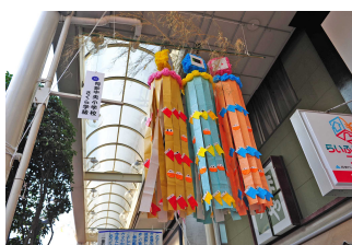
さくら学級の七夕飾り