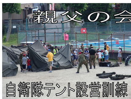
自衛隊テント設営訓練

保護者の皆様、地域の皆様におかれましては、今後も本校の子供たちを温かく支えていただくとともに御支援・御協力をよろしくお願いいたします。