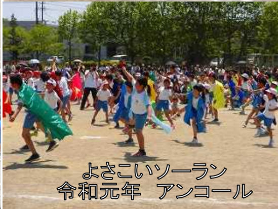
よさこいソーラン 令和元年 アンコール