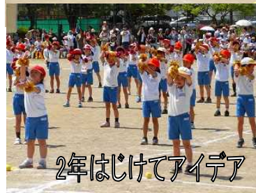
2年はじけてアイデア