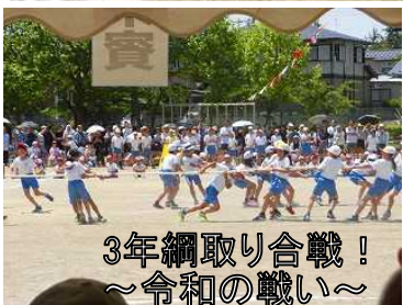
3年綱取り合戦! ～令和の戦い～