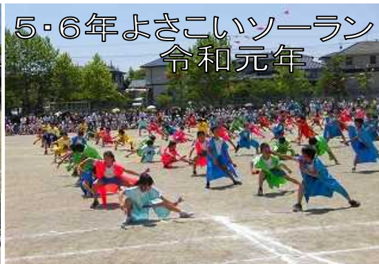
5・6年よさこいソーラン 令和元年