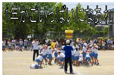
1年かごいっぱいになあれ

運動会では、各学年が赤、黄、青の3色に分かれ、しらかば児童会のスローガン「みんなで協力！笑顔😊あふれる中央小！！」の下、優勝を目指して頑張りました。昨年度優勝の赤チームから優勝杯が返還され、今年度は黄チームが優勝し、見事優勝杯を手に入れました。たくさんの御声援本当にありがとうございました。当日、おやじの会の皆様には、早朝の会場準備から始まり、演技中の会場警備や走路等への水撒き、さらには終了後の会場の後片付けまで、マイスクールの皆様には休憩所を開設していただきました。また、本校PTA役員の皆様には、児童の熱中症予防のための見守りやご来賓接待などの手厚い御支援をいただきました。おかげさまで子供たちは、安心して運動会に臨むことができました。心より御礼申し上げます。ありがとうございました。