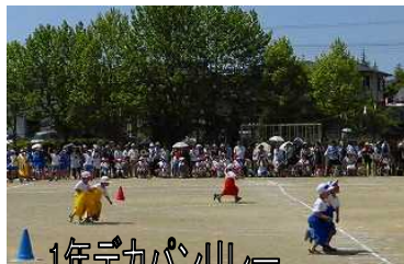
1年デカパンリレー