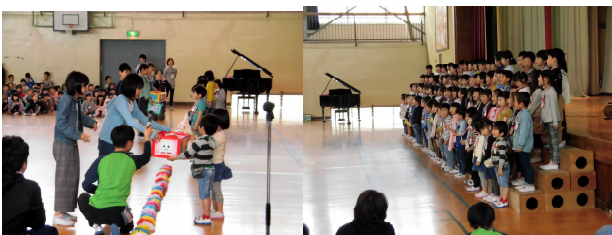
1年生にプレゼント 元気いっぱい1年生