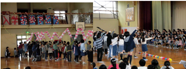
6年生と手をつないで 各学年の歌や踊りのお迎え 花のアーチで入場

平成31年4月25日に『1年生を迎える会』を開きました。1年生の皆さんに早く学校に慣れ、楽しく生活できるようにという気持ちをこめた会になりました。6年生が1年生と手をつないで入場し、会場はとっても和やかなムードになりました。