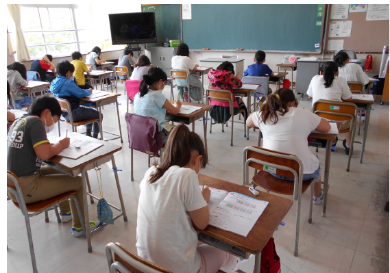
机を離れた教室での学習