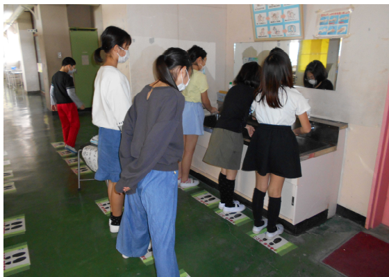
手洗い場では距離をとって並びます

始業式は校内放送で行い、校長・生徒指導主任から三密を避ける生活について呼び掛けました。「あつまらない・さわらない・しめきらない」を合い言葉に指導を続けていきます。また、感染防止のため、学校では、制約が多くありますが、子供たち・教職員が知恵を出し合い、楽しい学校生活を送れるようにしていきます。