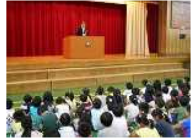
【しっかりと話を聞く子供たち】

保護者の皆様には、夏休み期間中にお忙しい中教育相談にご来校いただきありがとうございました。今後ご家庭との連携を密にし、子供たちのより良い成長のために努めて参りたいと思います。