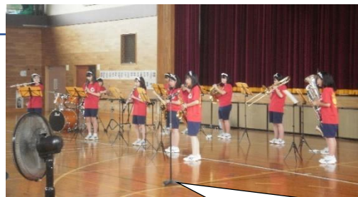
吹奏楽部の引退演奏会が開催されました（7/23）。