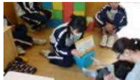
3年絵本の読み聞かせ