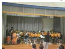
川前ふれあいまつり