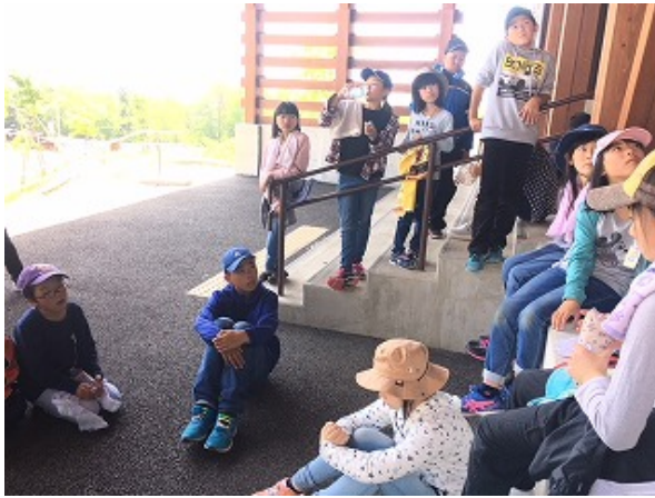
いよいよ最後のセレモニー、「別れのつどい」です。