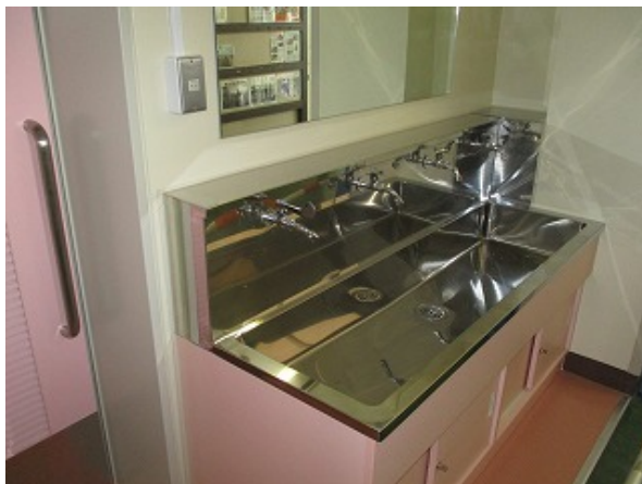
手洗い場もきれいになりました

7月から改築工事を行っていた西側トイレですが、先日完了検査が終了しました。淡いピンクと淡いグリーン色の新トイレ、洋式便器が増え、また車いすにも対応するなど、時代に合ったトイレに模様替えしました。手洗い場も同時に改築され、LED照明と相まって明るいトイレになりました。年明けからの使用開始を予定しています。授業参観等で来校時にどうぞご覧ください。