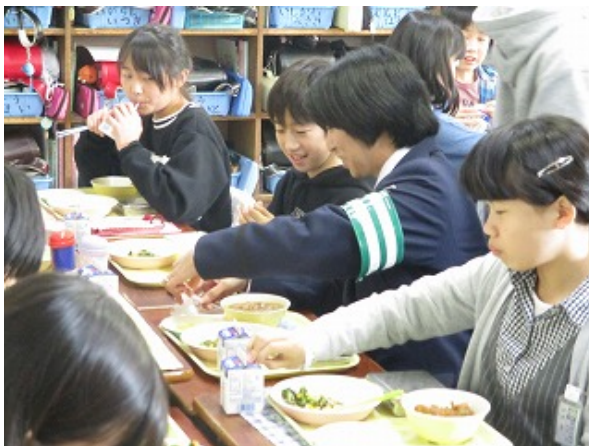
教室で一緒に給食