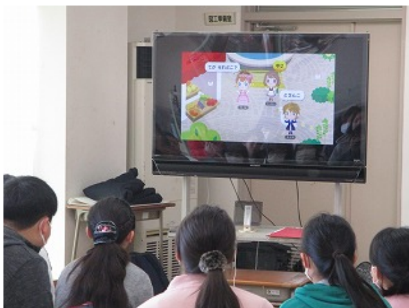
ビデオを視聴し問題を共有します