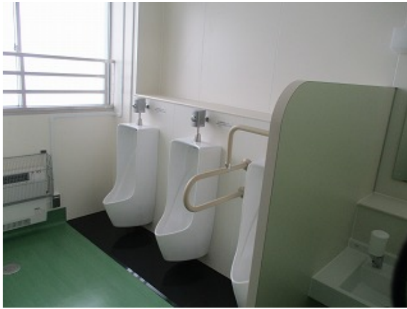
男子トイレはグリーンに