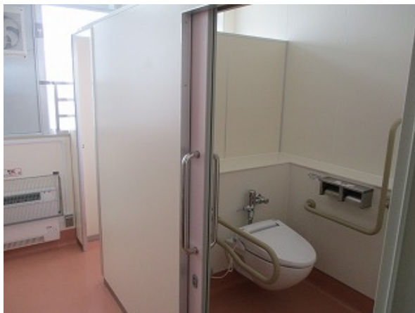
女子トイレはピンクに