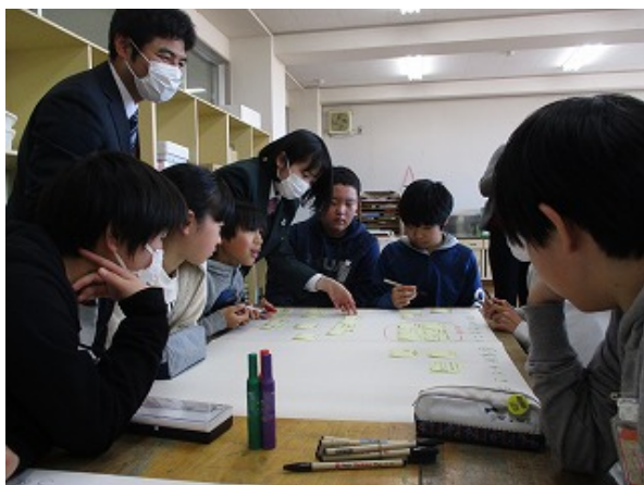
ファシリテーターは先輩方です