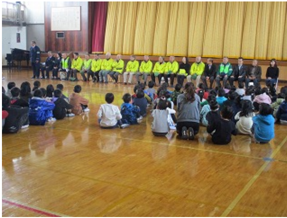
大勢の皆様に参加していただきました