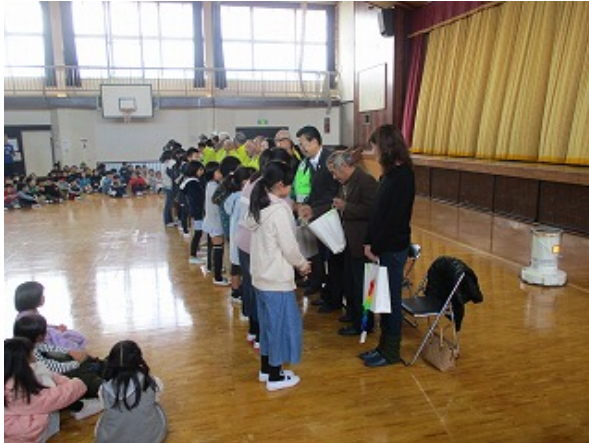
子供達からのプレゼント