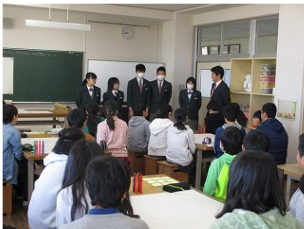
5名の先輩方が来校しました