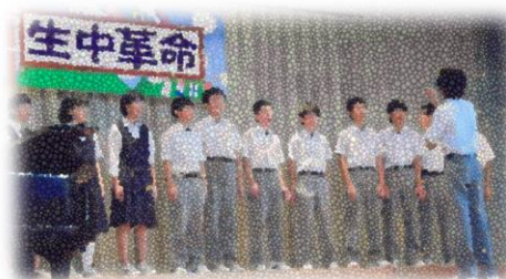
☆ 3 学年合唱