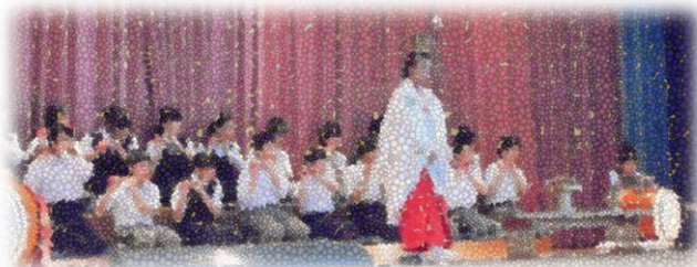
☆ 生出森八幡神社神楽「神子之舞」(1・2年)