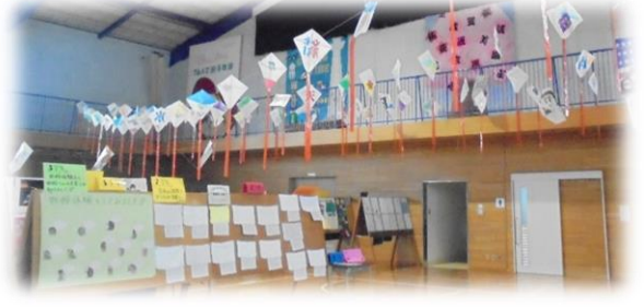
☆展示の部（個人新聞、連風等）