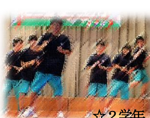
☆ 2 学年 (生徒会企画)