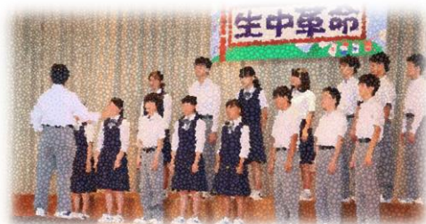
☆ 2 学年合唱