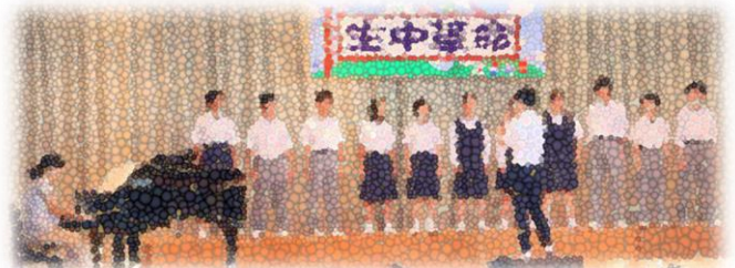
☆ 1 学年合唱