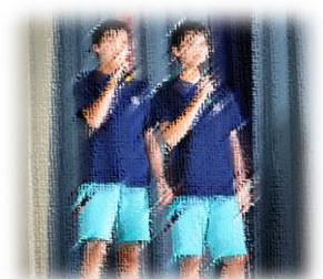
☆ 3 学年 (生徒会企画)