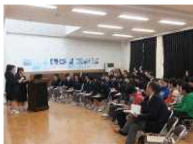
【老人保健施設 杜の倶楽部】

12月13日(水)5～6校時に、小学生や保護者、事業所の方をお招きして、職場体験学習発表会を行いました。今年、7つの事業所に御協力をいただき、充実した体験活動を行い、しっかりとまとめることができました。参加した1年生や小学生も、積極的に質問や感想を発表しました。翌14日(木)には、中山中学校との第4回交流学习が行われ、職場体験学習発表会に1、2年生が参加しました。生出中の生徒は、6つの会場に分かれ、中山中の生徒の発表を聞くとともに、自分たちもしっかりとした発表を行いました。御協力をいただいた事業所の皆様には、改めて感謝申し上げます。