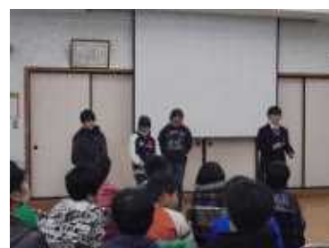
【感想発表も立派でした！】