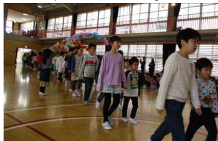
【1年生と6年生と一緒に入場】

1年生からのお礼は、歌とことば。感謝の気持ちのこもった元気いっぱいので発表でした。