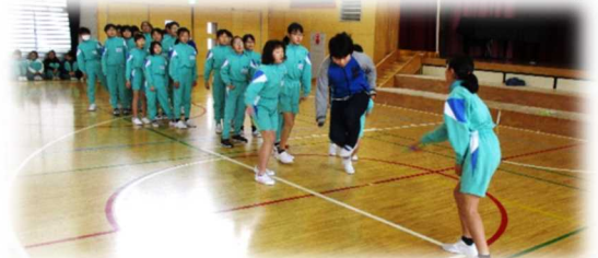
【高学年長なわ大会の様子】