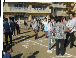
10月20日引渡し訓練の様子