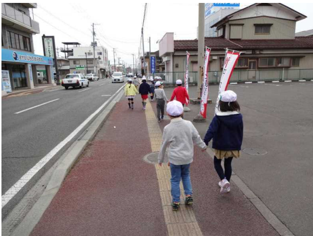
〈1年生は、2年生と手をつないで歩きました。〉

4月24日(水)に1年生と2年生が交通安全教室を行いました。初めに交通指導隊の方から歩行の際に注意することや横断歩道の安全な渡り方についてお話をうかがいました。その後、校外に出て実際に歩道の歩き方や横断歩道の渡り方を学習しました。