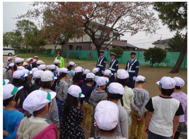
〈2年生は、お手本になるよう頑張りました。〉