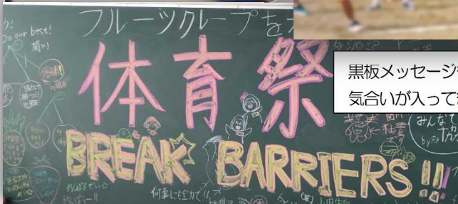
黒板メッセージも 気合いが入ってます！