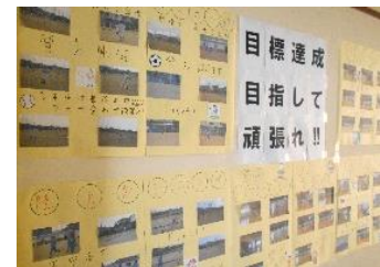
↑ 総合文化部が部活動風景を撮影し、コメント入りで作成。

速報掲示は総合文化部が担当し、最新情報をすぐに掲示してくれました。ありがとうございました。