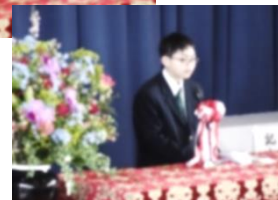
【送辞… 感謝を込めて】