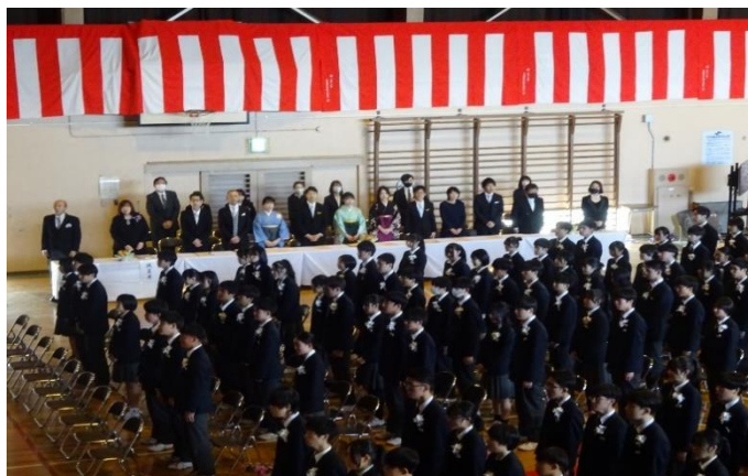
【一人一人に 卒業証書を授与】