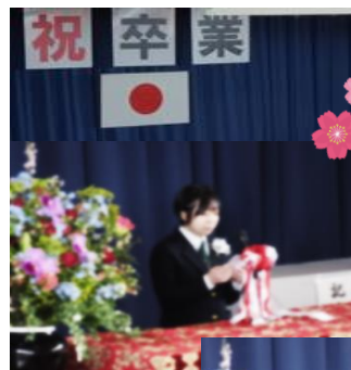
【答辞… 思いを託して】