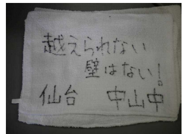
メッセージを記した雑巾の一部