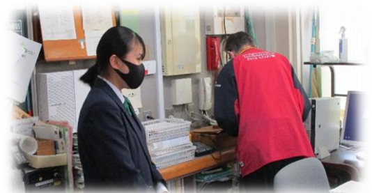
職員室からの放送の様子

最後に、S・Sさんからは「自分の命を守るため、大切な人の命も守るため、感染防止対策に努めましょう。みなさんの行動が誰かの命を救うはずです。」と結びました。学校長からも「命を守るための行動を」と強調しました。生徒会長と学校長で協同メッセージを発表するのは初めてのことですが、コロナの感染防止のために、これからも「命を守ること」を最優先に、「油断せずに」取り組んでいきたいと思ひます。