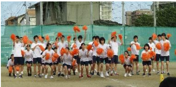
学年ごとの開催となった体育祭

コロナウイルス感染症の収束はまだ先ですが、夜明けは必ずやってきます。感染予防に最大限の配慮をしながらも、生徒達の歩みや成長を大切に令和3年度を創っていきたいと思います。