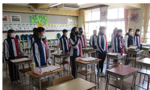
全国大会への推薦状 レベルの高いアンサンブル練習