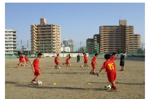
ドリブルなど個人練習から実施