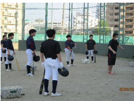
説明を聞くときにも間隔を十分に