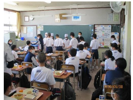
密を避け一列ごとに配膳する給食