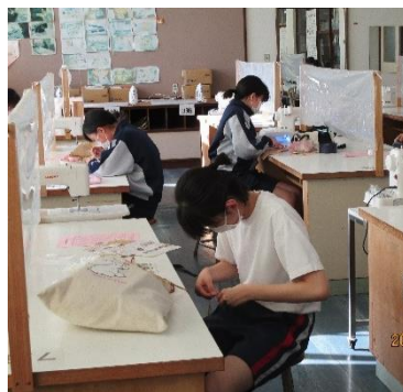
被服室の机上には衝立を手作り