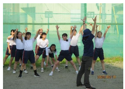
新体操部も校庭で基礎練習