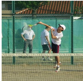
サーブのボールは自分で拾って