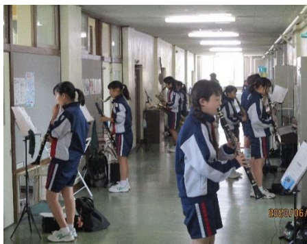
対面しないように距離をとって練習