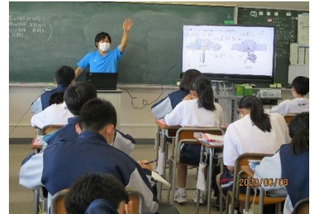
大型モニターを使った理科の授業

感染予防を徹底しつつ、手探りでスタートにはなりましたが、今後も教育活動を最大限充実させるために、職員一同精一杯頑張っていますので、ご理解とご協力のほど、よろしくお願いいたします。