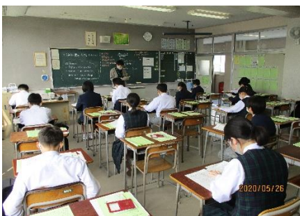
間隔を空けて着席しました。