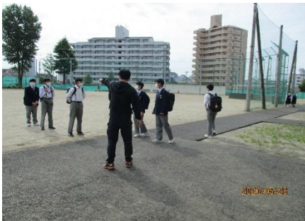
密にならないように整列しました。

↑ 掲示物などで生徒達を迎えました。(各学年目標) ↓ 感染予防対策と生徒の様子です。