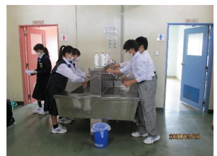
登校後は手洗いをしました。