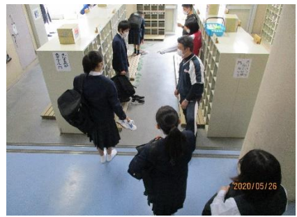
下校も間隔を意識させました。