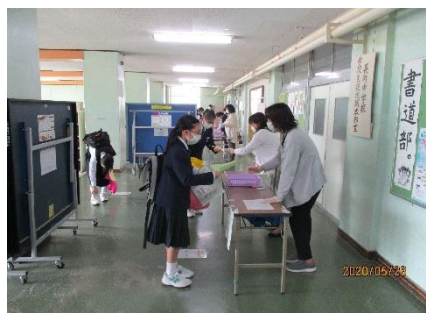
昇降口での体温チェックです。