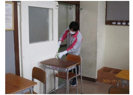
教室の消毒なども行いました。

※ 当日の授業では感染予防について指導しました。生徒に配付しました「新型コロナウイルス 感染予防対応マニュアル(長町中学校版)」をホームページにもアップしていますのでどうぞご覧下さい。