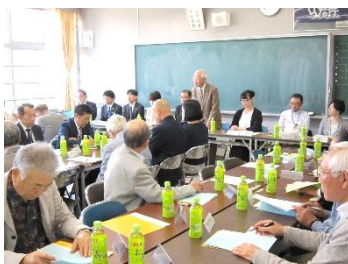
【健全育成連絡協議会】

5月9日(木)には学校の応援団である「学校支援地域本部連絡会」が開催され、校長から支援本部のみなさんに委嘱状をお渡しして、今年度の活動内容等を確認しました。今年度は2名のスーパーバイザーと7名の地域コーディネーターで活動を行います。10日(金)健全育成連絡協議会では小中学校をはじめ近隣の高校や地域の町内会・民生児童委員・警察署・幼稚園など、地域ぐるみで子どもたちを支えていくことを確認しました。また、17日(金)には「NON(長町中おやじネットワーク)総会」が行われ、中総体や夜間の巡視について話し合いました。長町中学生には多くの地域の皆様の支えがあって安全で安心な生活があります。「長町には地域のエネルギーがあること」、「本校の卒業生は長町で育ったことを誇りに思っていること」も話題に出ました。今後も輝ける子どもたちを育てていくためご支援をお願いいたします。