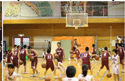
【バスケット部の活動紹介】