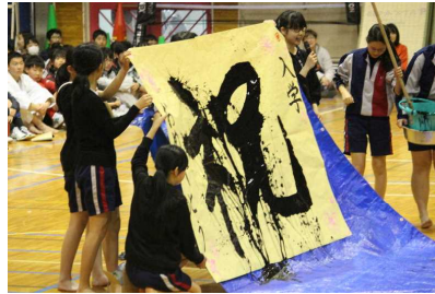
【書道部の活動紹介】