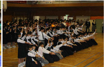
【ダンスパフォーマンス】