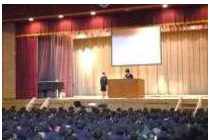
《代表生徒の活動報告》