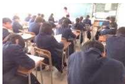
《教室での実態調査》