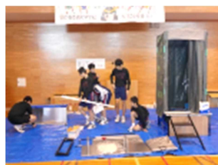
《鹿野地区防災訓練ボランティア》