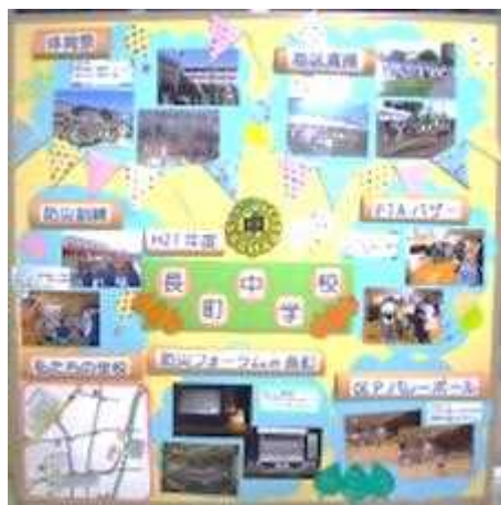
《展示されたパネル》

10月31日にはPTA学年連委員会主催の映画上映会が行われました。不登校ゼロを目指す大阪市立南住吉大空小学校の取組を紹介し文化庁芸術祭大賞など数々の賞を受賞した「みんなの学校」を鑑賞しました。発達障害を抱えた子や自分の気持ちをうまくコントロールできない子などとの教職員、保護者、地域の大人たちとの関わりを劇場版として再編集した感動の作品でした。その後は総務委員会主催のバザーも行われ、整理券を発行するほどの盛況の内に終了しました。