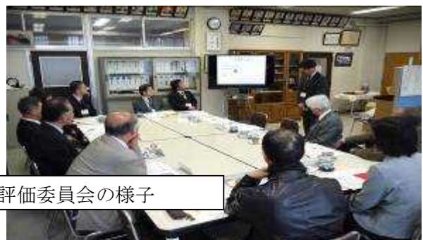
5月1日に実施した学校関係者評価委員会の様子