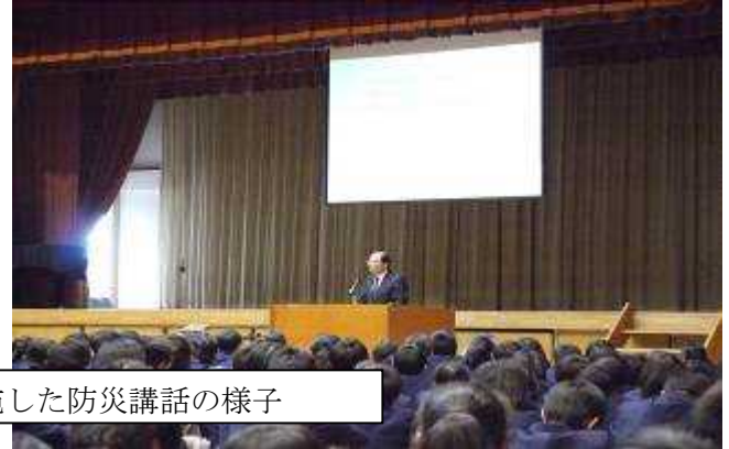
5月2日に実施した防災講話の様子

5月2日(木)、5、6時間目の総合的な学習の時間で、防災に関する特別授業を行いました。講師に山形大学教職大学院の村山良之教授をお招きして、約1時間に渡りお話いただき、意義ある時間を過ごしました。先生からは、これまでの大地震がどのような被害をもたらしたのか、どんな理由でけがをしているのか、地震が発生する前の準備と起きてからの対処法、そして今できることなどを詳しく教えていただきました。そしてこの講話から生徒一人一人が家族を動かして、家族のなかでできることを実行してほしいとお話もありました。