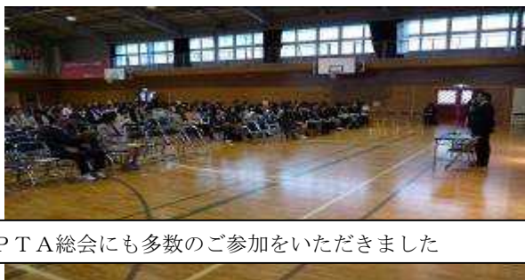
PTA総会にも多数のご参加をいただきました

4月26日(金)の学校公開日に際しましては、荒天のなか、多数のご参加をいただきありがとうございました。午前中の授業公開、そして午後の父母教師会総会、学年・学級懇談にご支援、ご協力いただきましたことは、学校として大変うれしく思っております。今後もよき学校づくりのために、教職員一同、力を