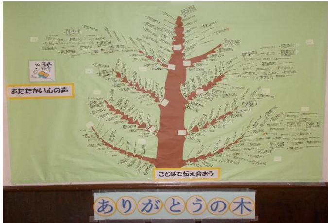
感謝の気持ちを伝え合う ありがとうの木