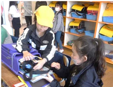
【6年生が優しくお世話】

入学当初は、ドキドキした表情が見られた1年生27名。6年生や小1サポーターの方々の支援もあり、今ではすっかり小学校生活に慣れてきました。学年が一つずつ上がった子供たちも、落ち着いて学習に取り組み、友達と仲良く元気に学校生活を送る姿が見られます。