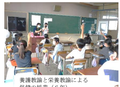
養護教諭と栄養教諭による保健の授業（6年）

1学期終業式の日には、お子さんの学習や生活の様子を記入した通信票をお渡しします。お子さんと一緒に御覧いただき、頑張ったことを大いに褒めていただければと思います。通信票の見方も一緒にお渡ししますので御参照ください。秋休みは、土日をはさんで10月12日（月）までの3日間です。13日（火）からまた2学期後半が始まりますので御協力をお願いいたします。