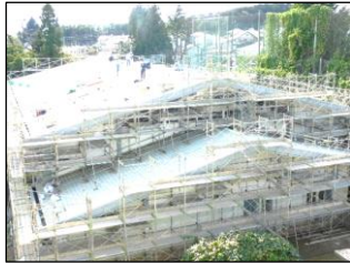
体育館屋根改修工事中